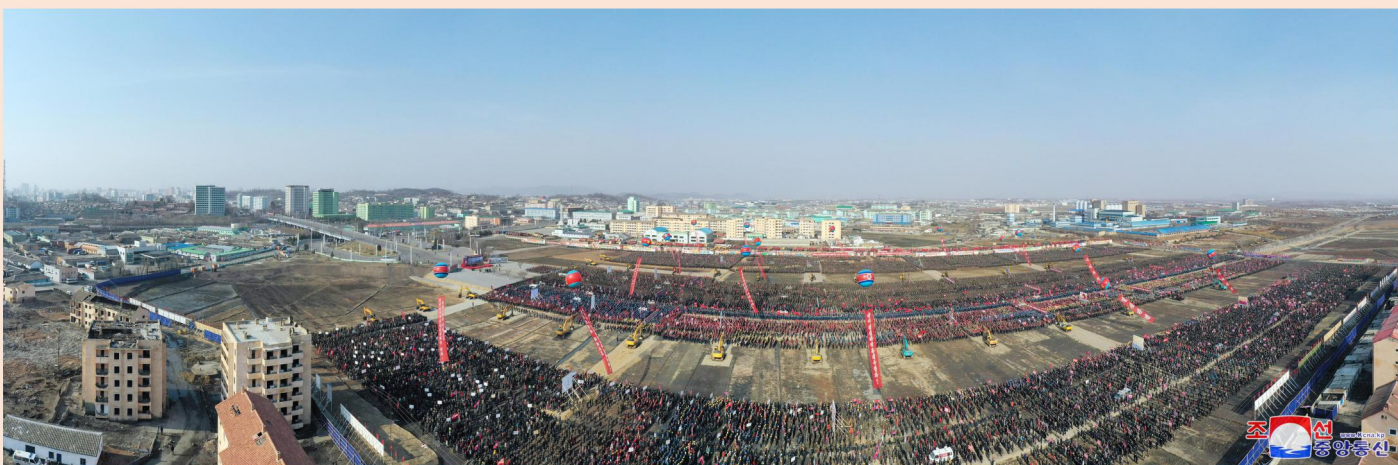
(朝中社平壤 3 月 23 日电)