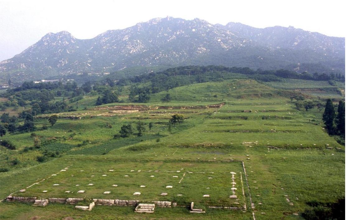
高丽时期王宫遗址满月台