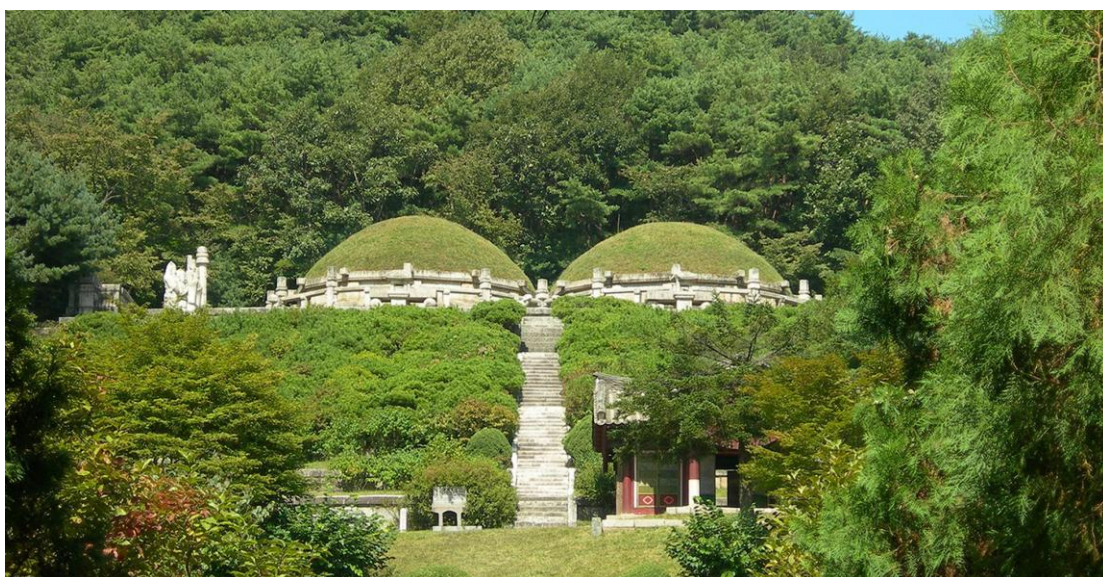
敬孝王陵（恭愍王陵）