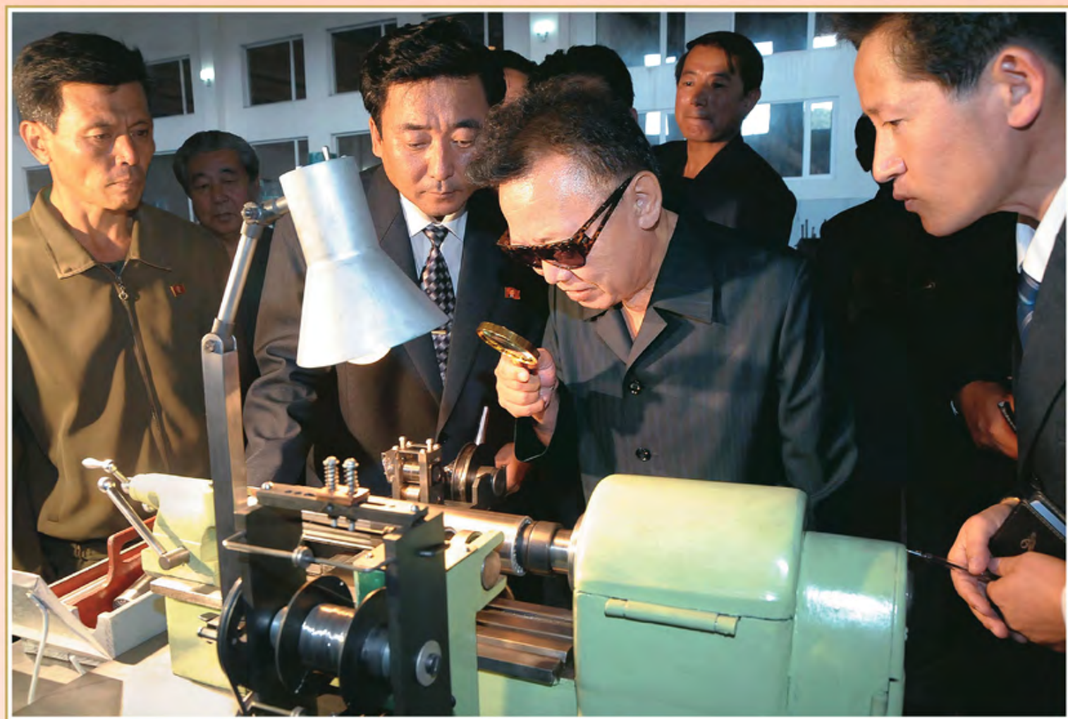
伟大领导者金正日同志视察某一机械厂。2009年9月