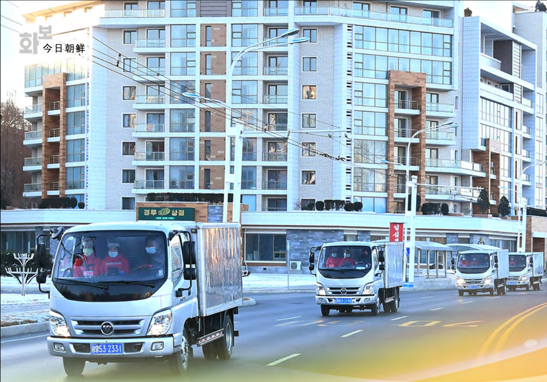
载有供给儿童的奶制品的车辆奔驰