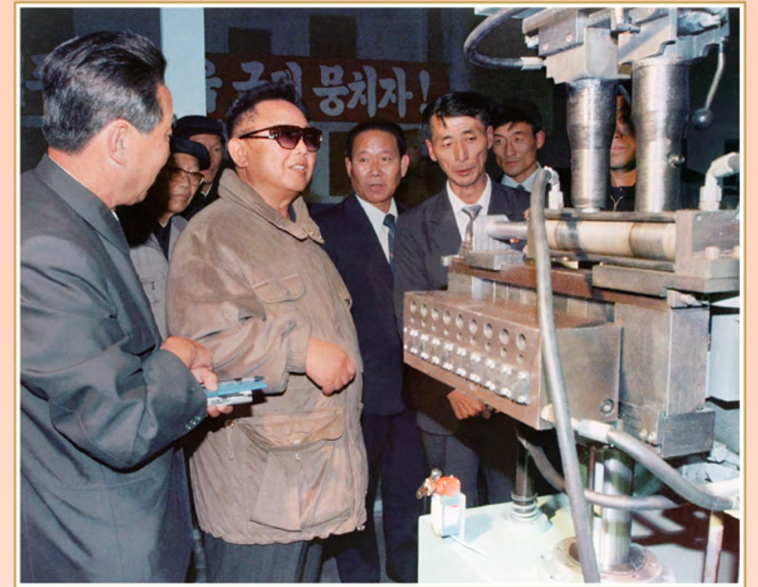
伟大领导者金正日同志视察乐元机械联合企业。2002年10月

金正日同志顺应新时代要求提出经济建设路线，指明经济强国建设的方向和途径。关于优先发展国防工业，同时发展轻工业和农业的经济建设路线是在帝国主义者的极端威胁、封锁和制裁中推进经济建设的最正确的路线。