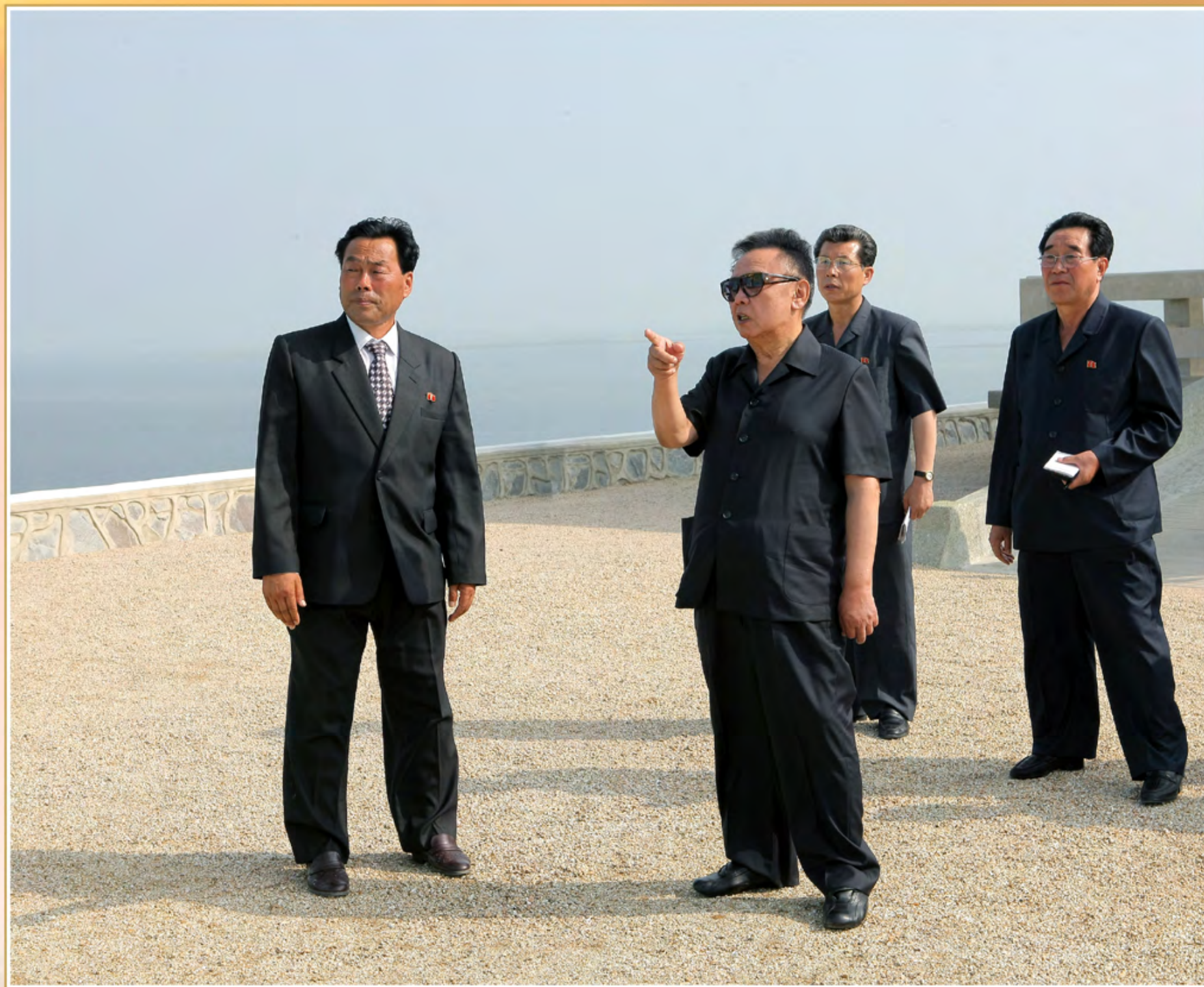
伟大领导者金正日同志视察完工的大溪岛海涂。2010年7月