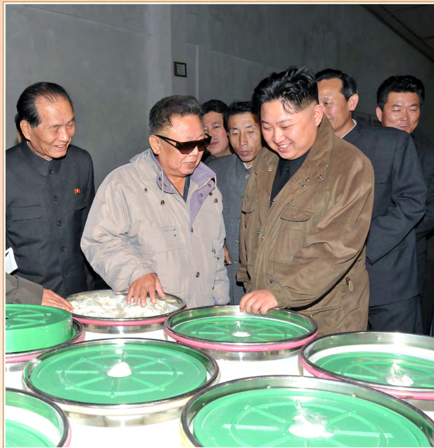
伟大领导者金正日同志和敬爱的金正恩同志视察二八维纶联合企业。2011年10月