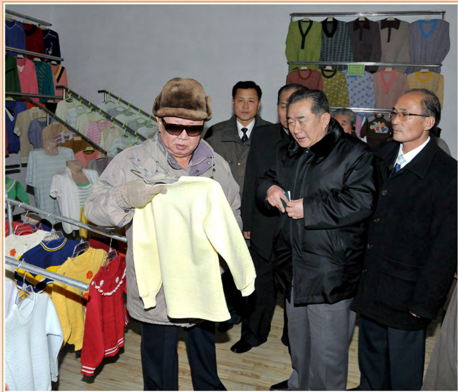
伟大领导者金正日同志察看咸兴针织厂的产品。2011年12月

金正日同志不辞辛劳，呕心沥血，造福于民，工厂企业和农场田间路上都留有他的火热气息。