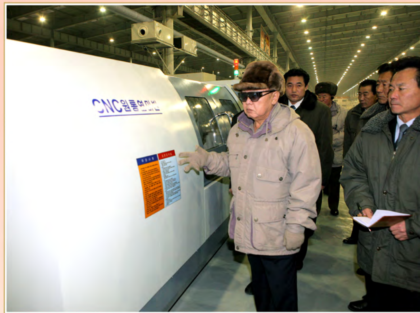
伟大领导者金正日同志察看CNC机床。2010年12月