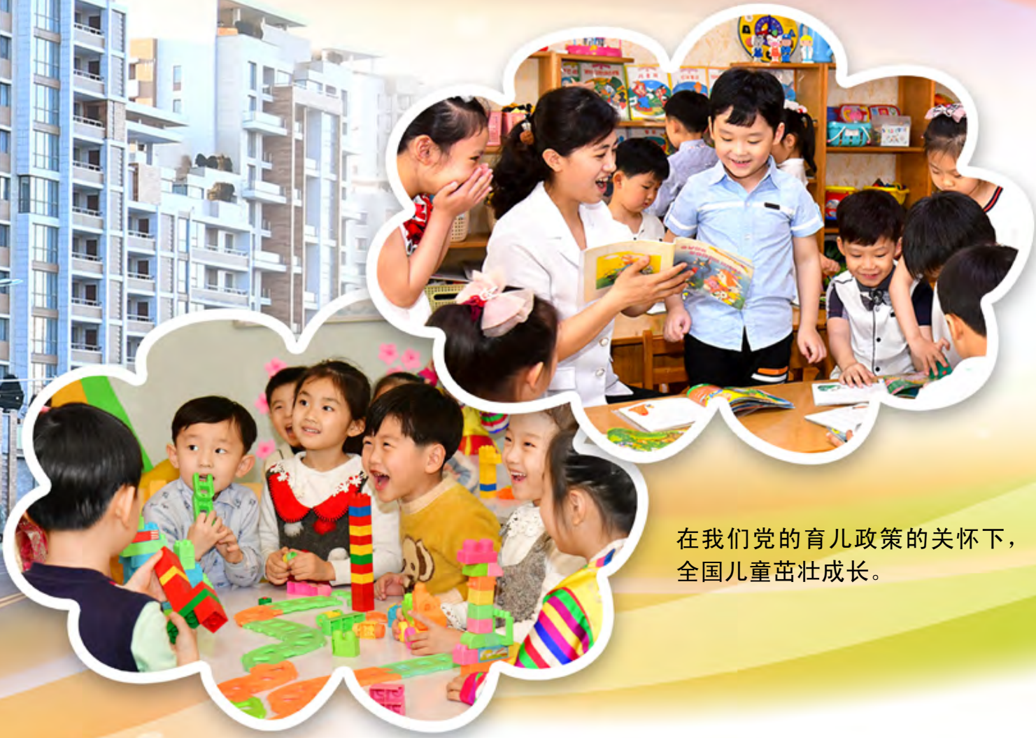
在我们党的育儿政策的关怀下， 全国儿童茁壮成长。

大量建起了奶牛饲养管理和牛奶生产所需设施和设备齐全的牧场，新设或改造奶制品生产工序，不断扩大生产能力。