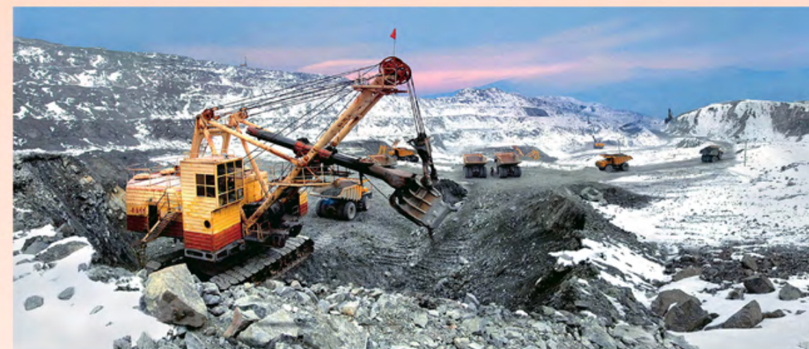
茂山矿山联合企业热火朝天，生产铁矿石

金正日同志缔造了自立经济发展的宝贵财富。如不断加强冶金工业、化学工业、电力工业等基于工业部门的主体化，建设为提高人民生活水平做出贡献的现代化轻工业基地，按照社会主义朝鲜的面貌，使国家的土地焕然一新，增加农业生产等。