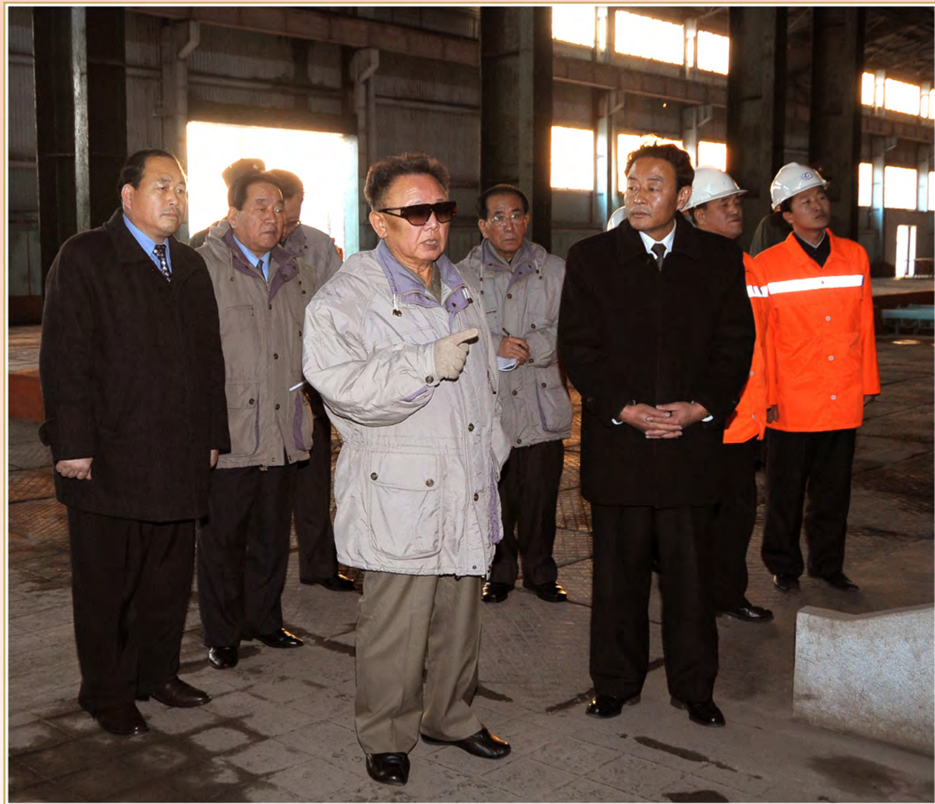
伟大领导者金正日同志视察千里马炼钢联合企业，点燃了新的革命大高潮火炬。2008年12月