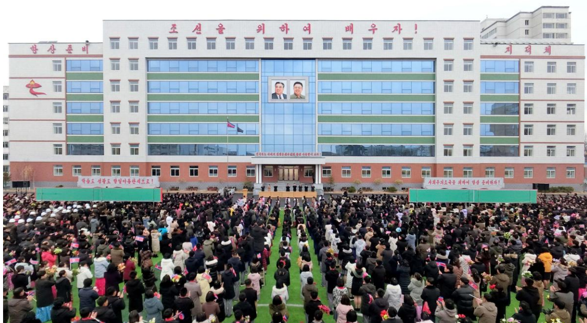
2025 年 11 月 27 日学生和教职员出席竣工典礼。