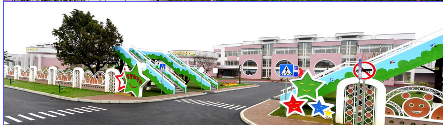
平壤育幼院、保育院