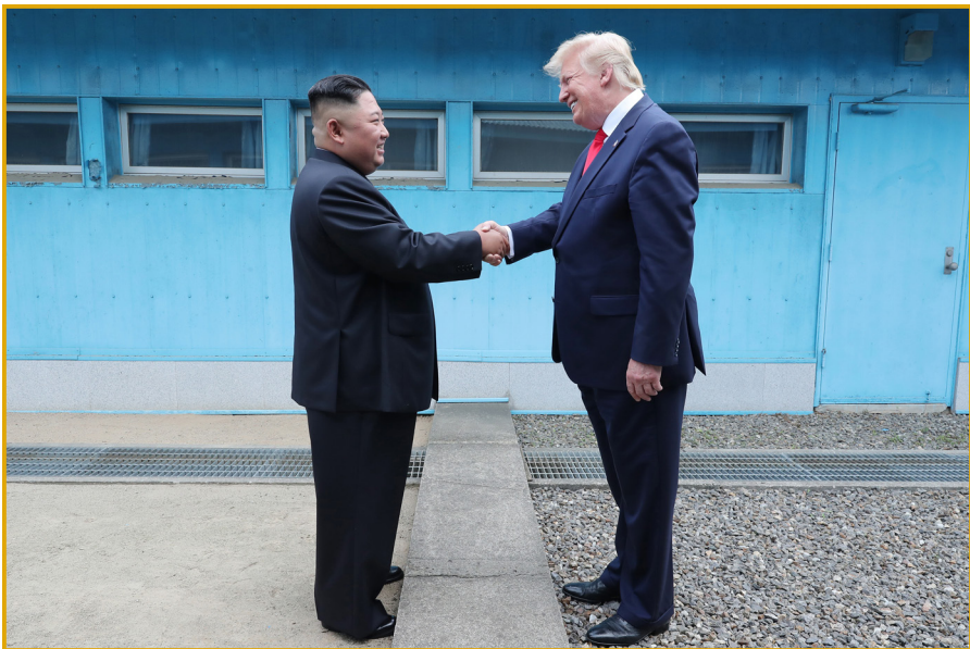
朝鲜劳动党委员长金正恩同志在板门店与美利坚合众国 总统特朗普举行历史性会晤。 2019年6月