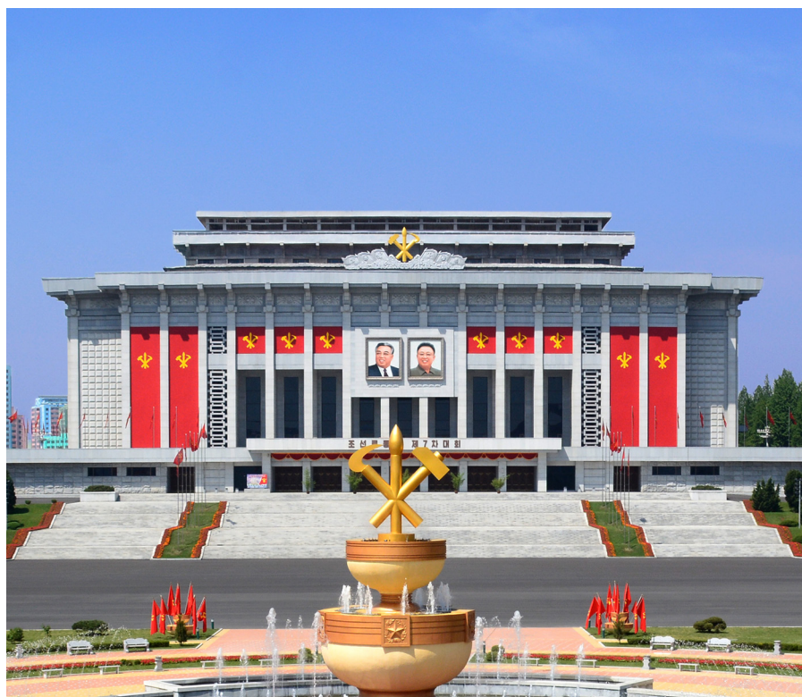
2016年5月，朝鲜劳动党第七次代表大会在四·二五文化会馆举行。