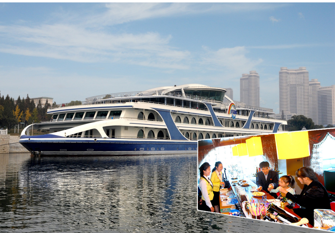
综合服务船“彩虹”号