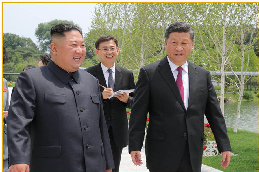
朝鲜劳动党委员长金正恩同志与中共中央总书记、 中华人民共和国主席习近平同志边散步边交谈。