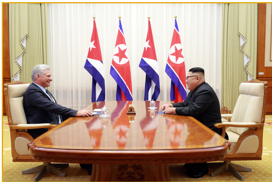
朝鲜劳动党委员长金正恩同志与古巴国务委员会主席兼部长会议主席米格尔·马里奥·迪亚斯-卡内尔·贝穆德斯同志举行会谈。