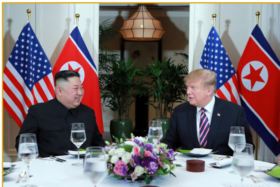
朝鲜劳动党委员长金正恩同志在越南河内与美利坚合众国 总统特朗普重逢，举行单独交谈，共进晚餐。