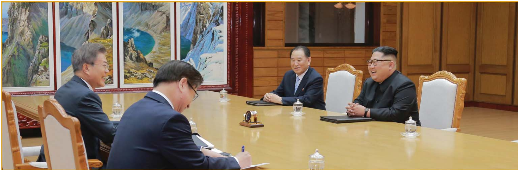
金正恩同志与文在寅总统进行会谈。2018年5月