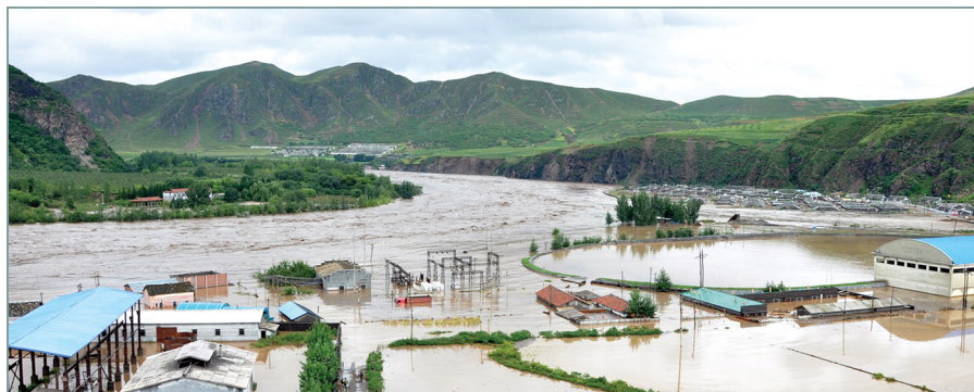
北部灾区部分现场