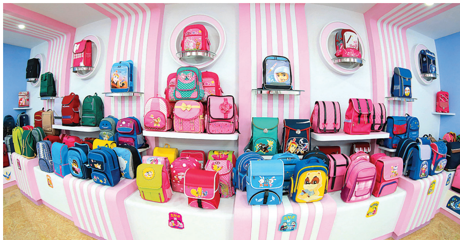
平壤皮包厂展示场

柳京眼科综合医院等增进人民健康的医疗基地和白头山英雄青年第三号发电站等时代的纪念碑式建筑物。新建或改建龙岳山制皂厂、蒲公英笔记本厂、平壤粮食加工厂、平壤甲鱼养殖厂等提高人民生活水平的轻工业工厂和万景台少年团夏令营等很多项目。