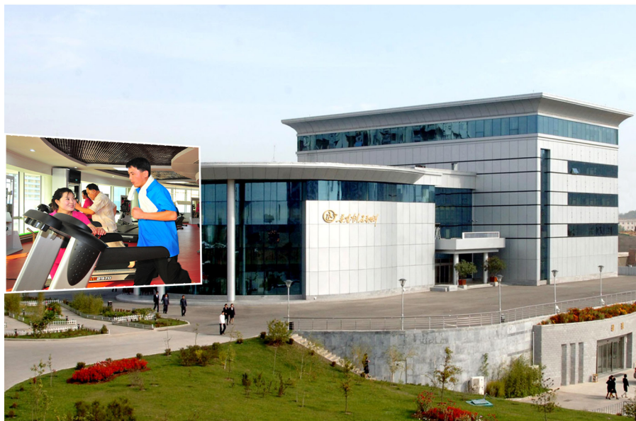
统一大街健身中心