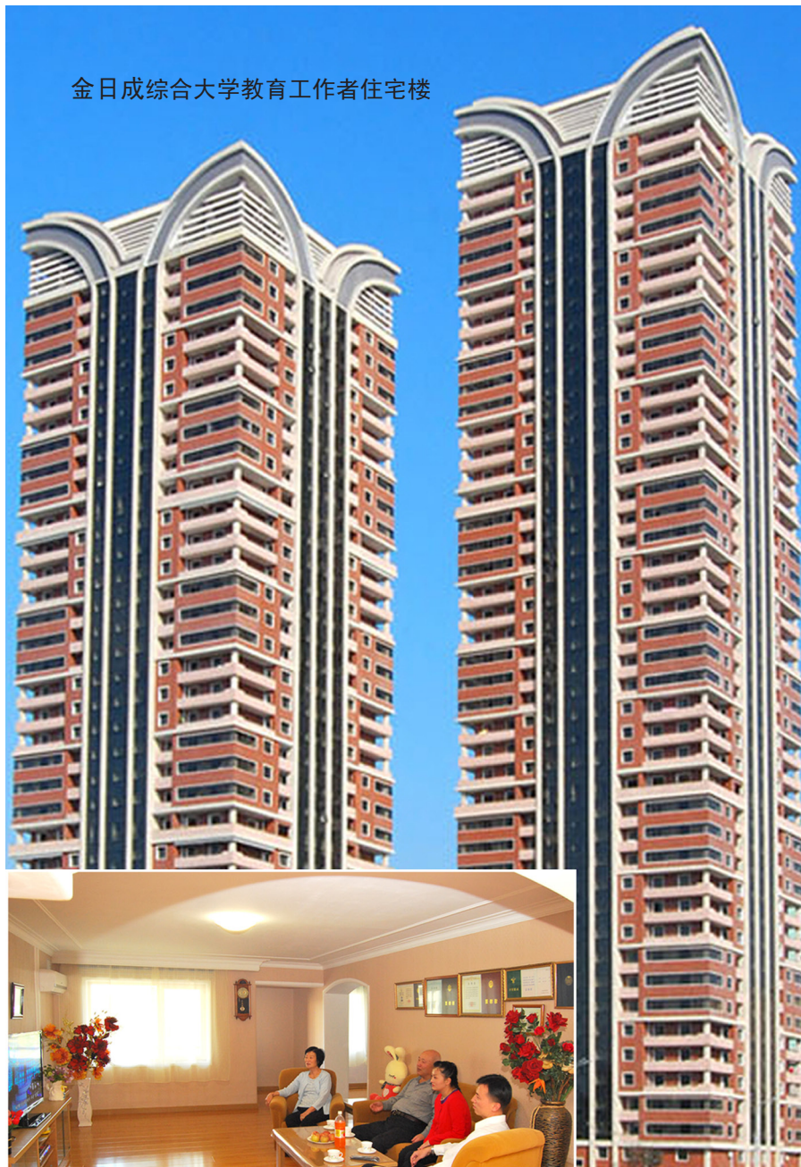
金日成综合大学教育工作者住宅楼