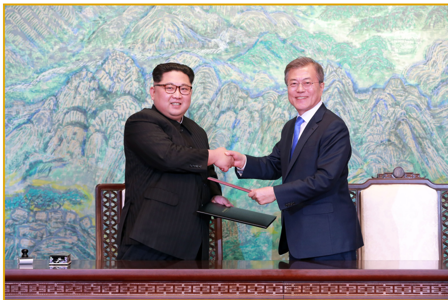
金正恩同志与文在寅总统签署历史性的板门店宣言，互换宣言书。