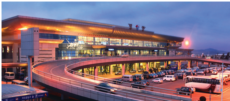
平壤国际机场航站楼