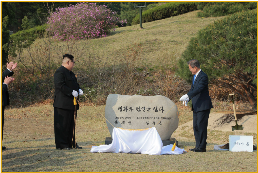
金正恩同志与文在寅总统一起植树留念，为标志碑揭幕。