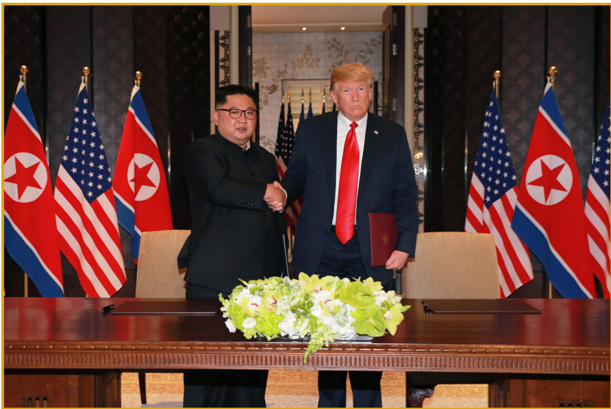
朝鲜劳动党委员长金正恩同志与美利坚合众国总统 唐纳德·约翰·特朗普签署联合声明。 2018年6月