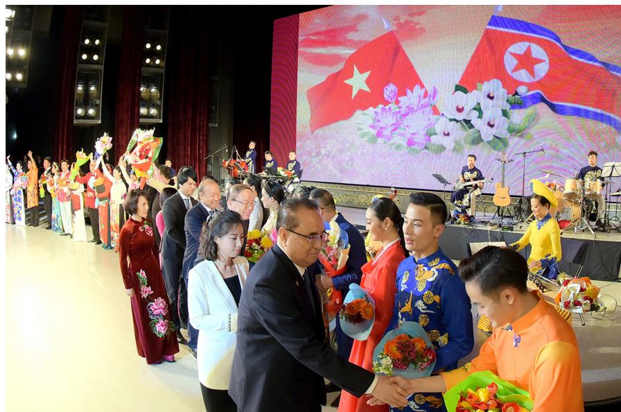
2019年4月，越南国家艺术团在朝鲜举行演出《春天的阳光》。