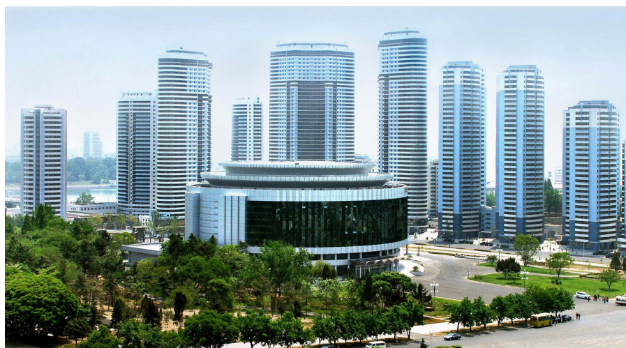
仓田大街和人民剧院

尤其是，圆形原声剧场的观众席分几个单元，安排在舞台的前后左右，观众在不同的角度观赏演出，而且演员和观众能够很好地进行感情交流。人民剧院按照现代审美观和建筑学上的要求修建完成，从而，人们可以享受作为社会主义文化创造者、享有者的幸福生活。