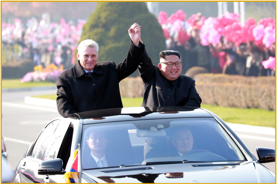
朝鲜劳动党委员长金正恩同志与古巴国务委员会主席兼部长会议主席 米格尔·马里奥·迪亚斯—卡内尔·贝穆德斯同志 向欢迎群众举手致礼。 2018年11月