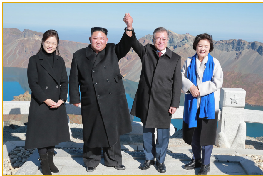
金正恩同志与文在寅总统一起登上白头山。2018年9月