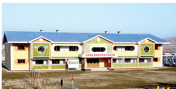
翻天覆地的 北部灾区