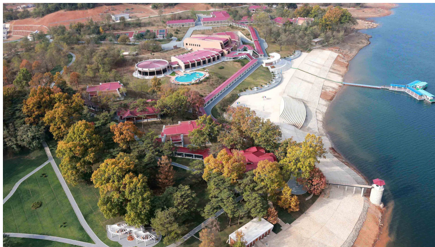
延丰科学家休养所