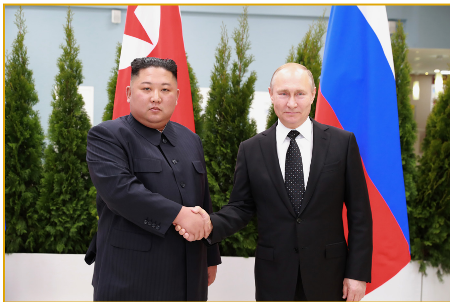
朝鲜劳动党委员长金正恩同志与俄罗斯联邦总统 弗拉基米尔·弗拉基米罗维奇·普京会晤。 2019年4月