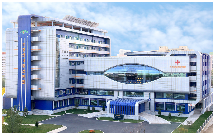
柳京眼科综合医院