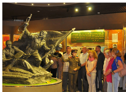
祖国解放战争胜利纪念馆