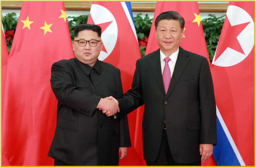
朝鲜劳动党委员长金正恩同志与中共中央总书记、 中华人民共和国主席习近平同志会晤。 2018年5月