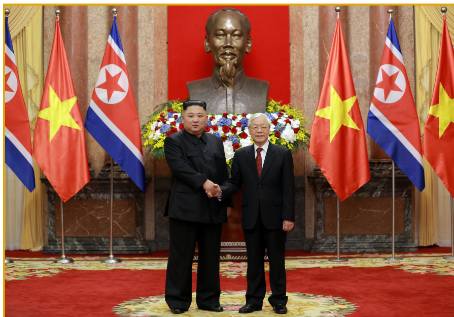
朝鲜劳动党委员长金正恩同志与越共中央总书记、 国家主席阮富仲同志会晤。 2019年3月