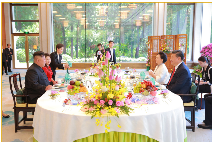
朝鲜劳动党委员长金正恩同志与中共中央总书记、 中华人民共和国主席习近平同志共进午餐。