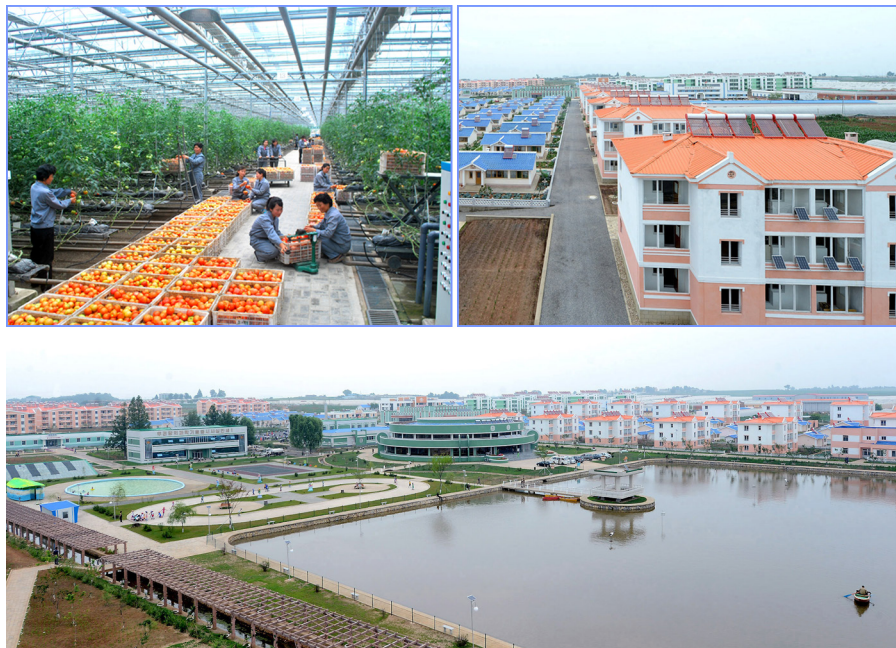
平壤市寺洞区将泉蔬菜专业合作农场

2015年6月30日，平壤市寺洞区将泉蔬菜专业合作农场建设成为社会主义文明农村的样板农场，蔬菜温室、住房和公共建筑竣工仪式隆重举行，充满乔迁之喜。