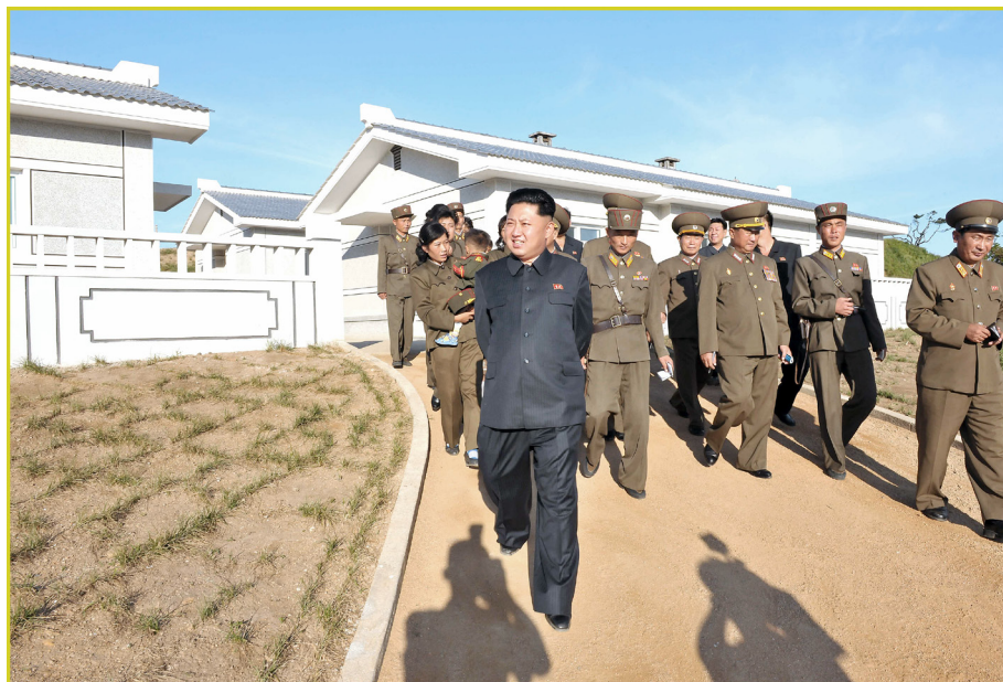
敬爱的最高领导者金正恩同志视察新建的长财岛防御队军属住房。