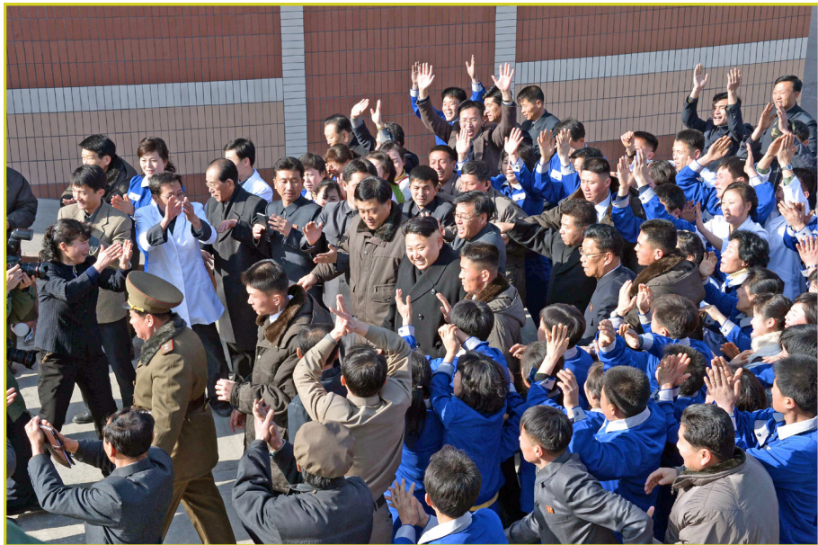
敬爱的最高领导者金正恩同志视察平壤市食用菌厂（时称）。