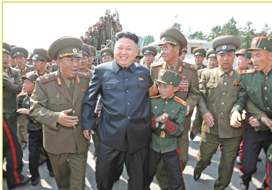
在朝鲜少年团成立68周年之际，敬爱的最高领导者金正恩同志 访问万景台革命学院。