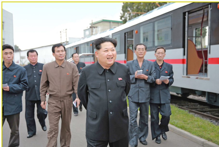
敬爱的最高领导者金正恩同志视察金钟泰电力机车联合企业。