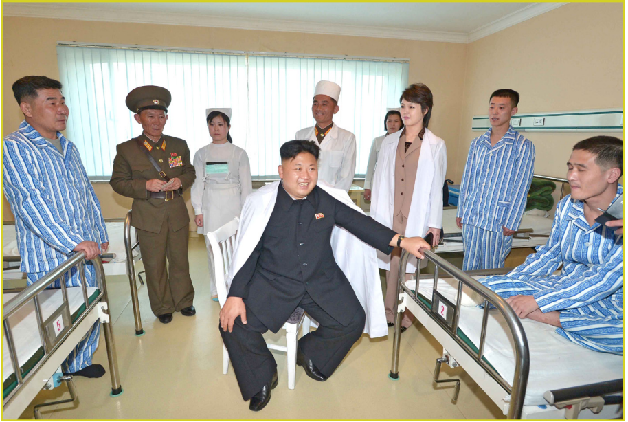
敬爱的最高领导者金正恩同志去大城山综合医院 探望战斗训练中受伤的军人。