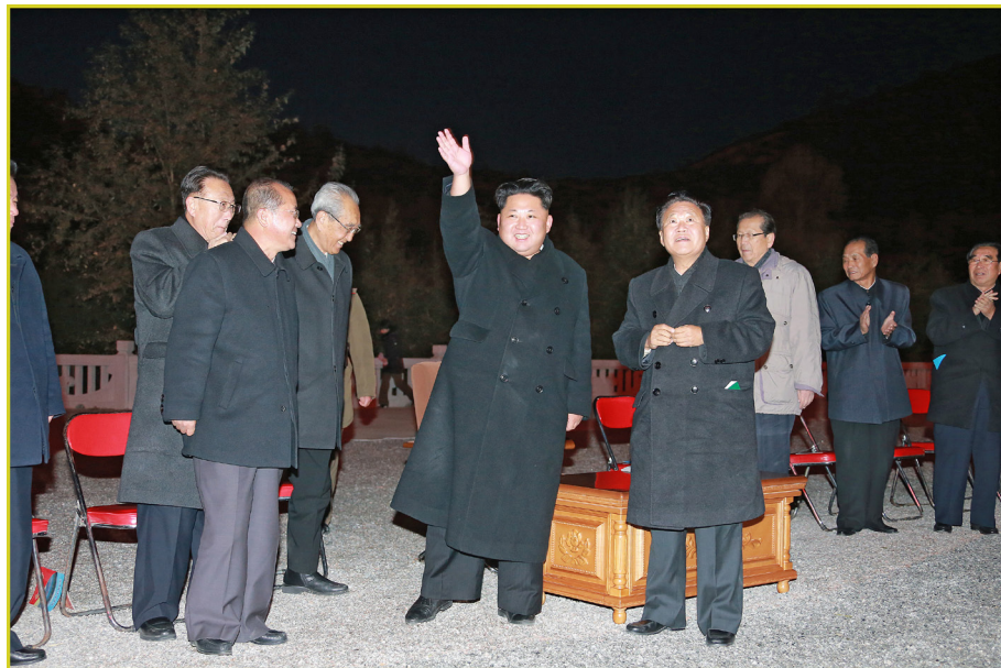
敬爱的最高领导者金正恩同志视察 完工的白头山英雄青年发电站， 向欢呼的青年挥手致意。