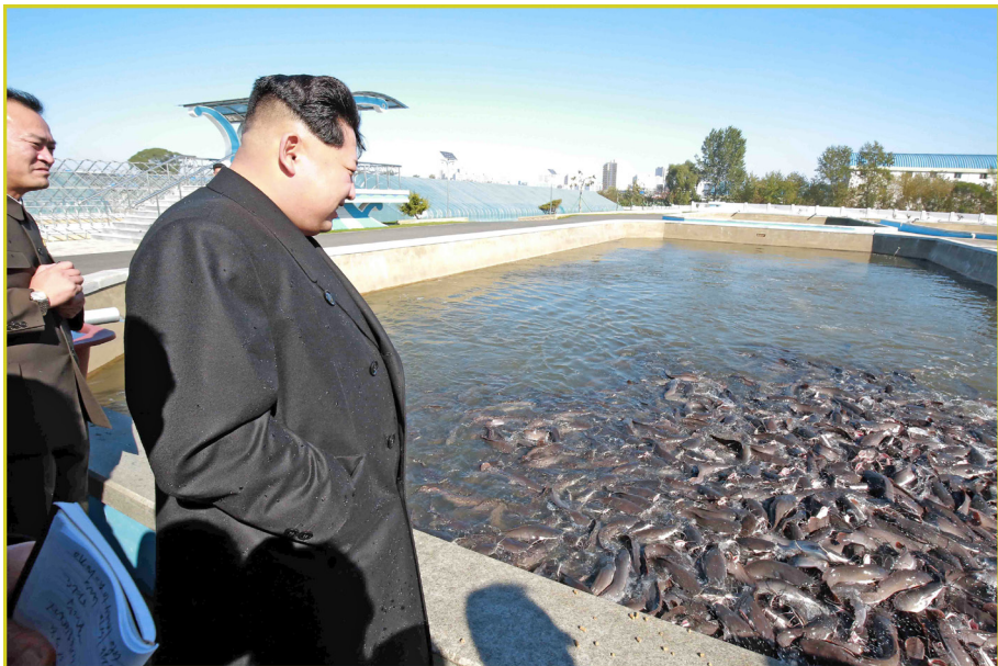
敬爱的最高领导者金正恩同志视察平壤鲇鱼养殖厂。