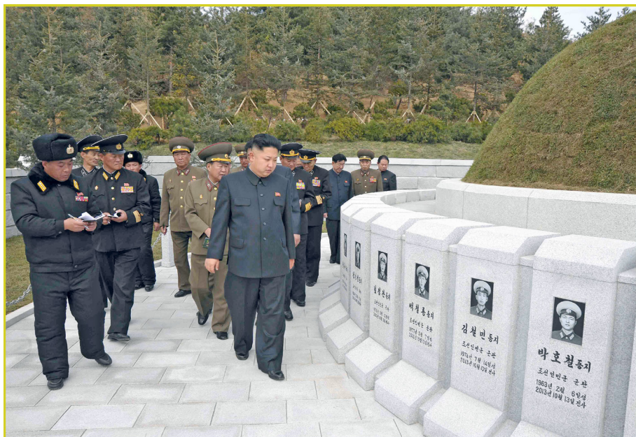
敬爱的最高领导者金正恩同志察看执行战斗任务中 不幸牺牲的海军部队勇士们的坟墓。