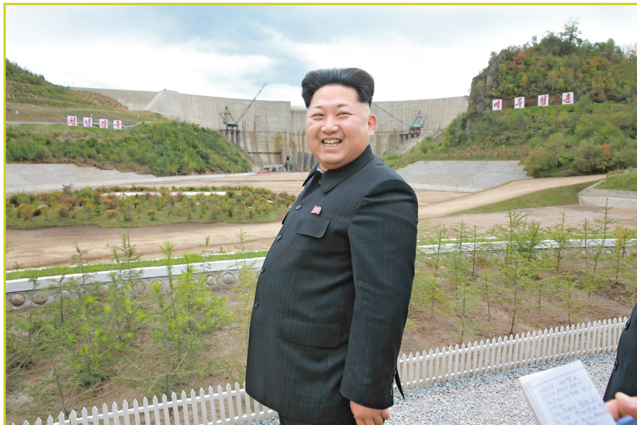
敬爱的最高领导者金正恩同志视察白头山英雄青年发电站建设工地。