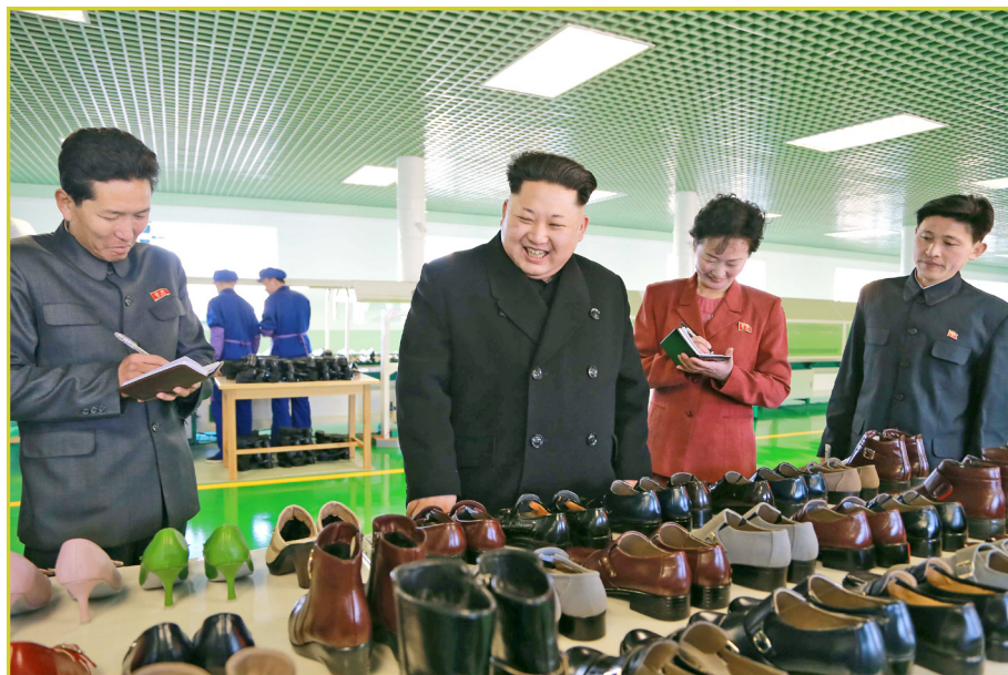
敬爱的最高领导者金正恩同志视察元山皮鞋厂。