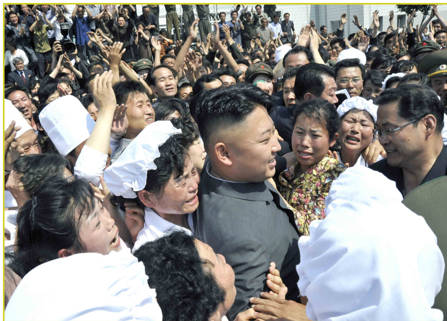
敬爱的最高领导者金正恩同志视察平壤基础副食品厂。