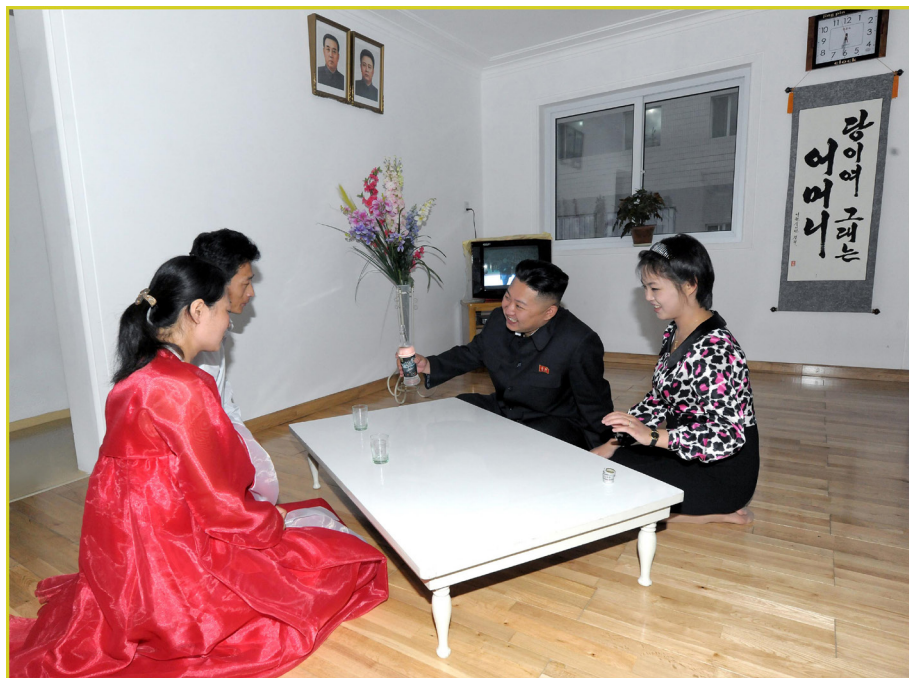
敬爱的最高领导者金正恩同志探望喜迁仓田大街新居的文刚顺之家。