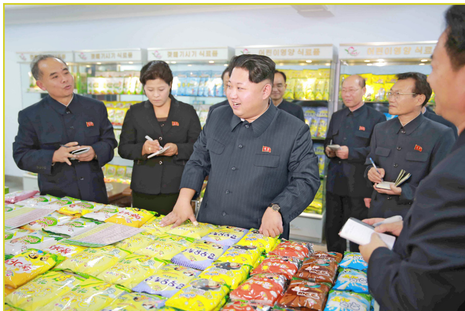
敬爱的最高领导者金正恩同志视察平壤儿童食品厂。