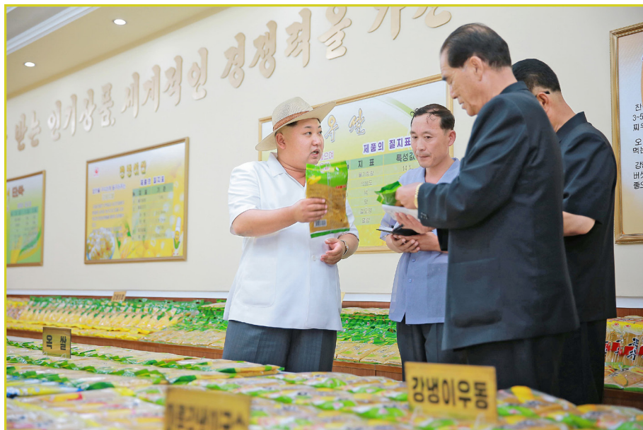
敬爱的最高领导者金正恩同志视察平壤玉米加工厂。