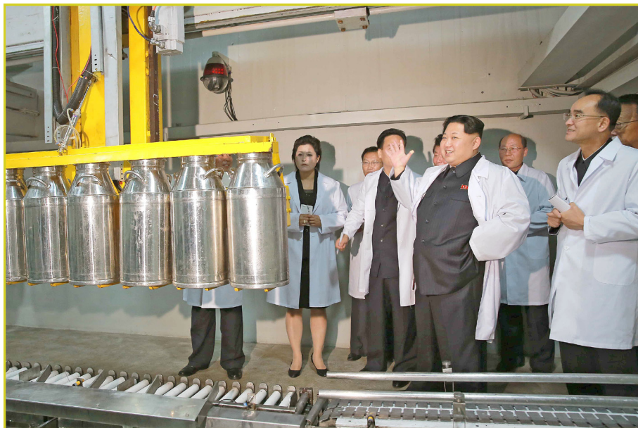
敬爱的最高领导者金正恩同志视察平壤儿童食品厂。