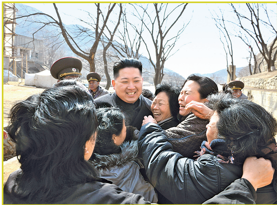
敬爱的最高领导者金正恩同志和椒岛防御队军人家属在一起。