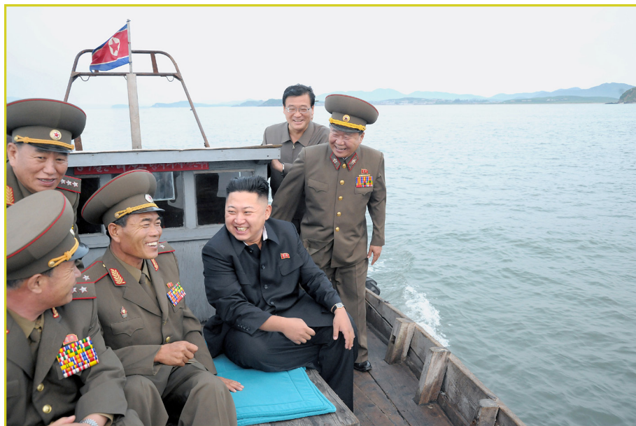
敬爱的最高领导者金正恩同志前往长财岛和茂岛。