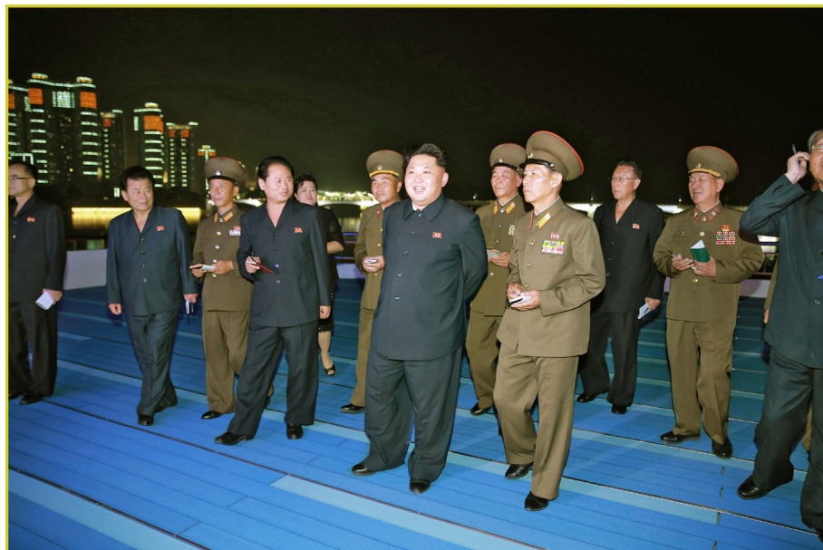
敬爱的最高领导者金正恩同志视察新制造的综合服务船“彩虹”号。