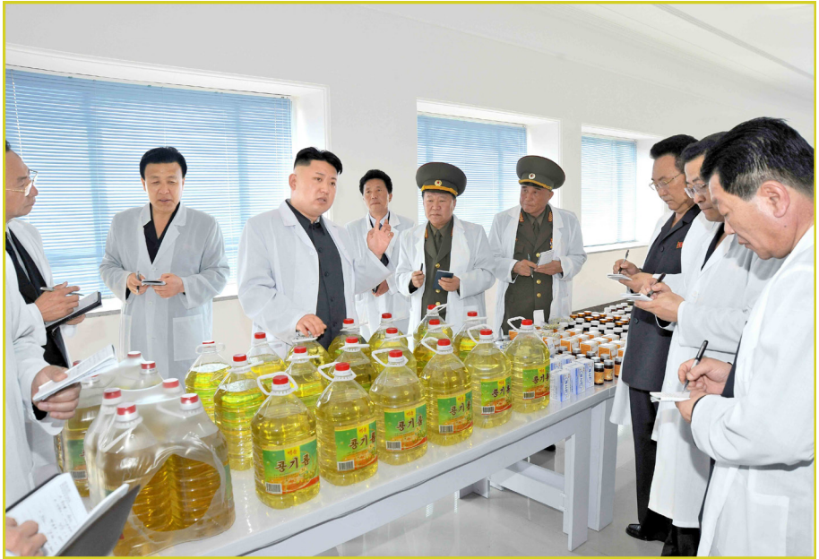
敬爱的最高领导者金正恩同志视察平壤基础副食品厂。