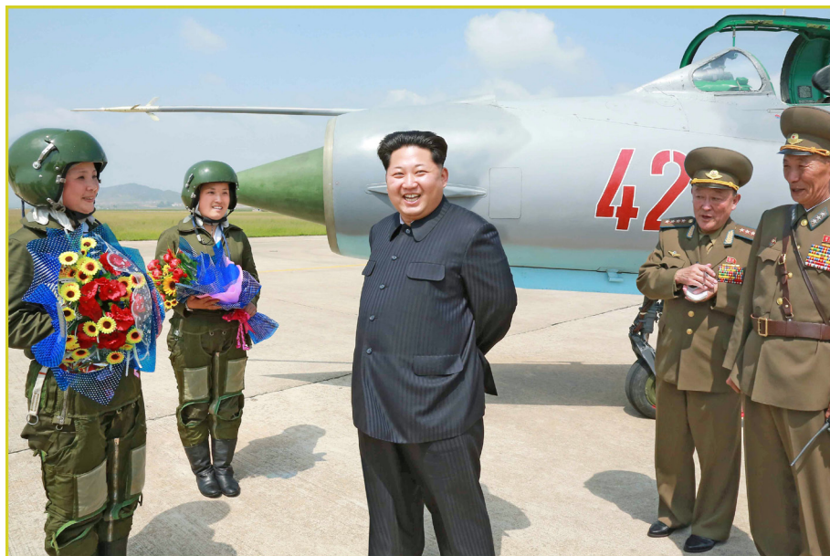
敬爱的最高领导者金正恩同志会见超音速歼击机女飞行员。