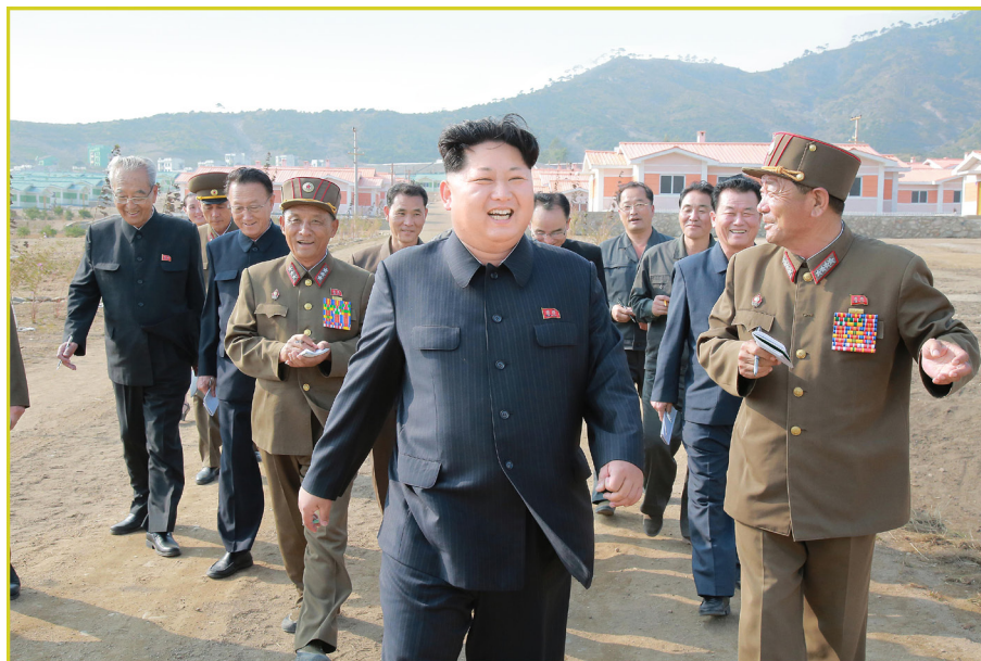
敬爱的最高领导者金正恩同志察看已完工的 罗先市先锋区白鹤洞（时称）住房。