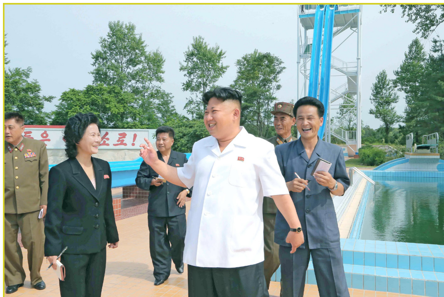
敬爱的最高领导者金正恩同志视察松涛园国际少年团夏令营。