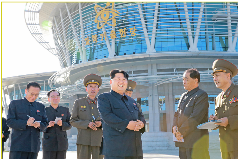
敬爱的最高领导者金正恩同志视察已建好的科学技术殿堂。