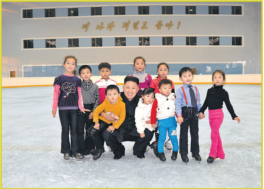
敬爱的最高领导者金正恩同志在人民露天滑冰场 同孩子们一起合影留念。