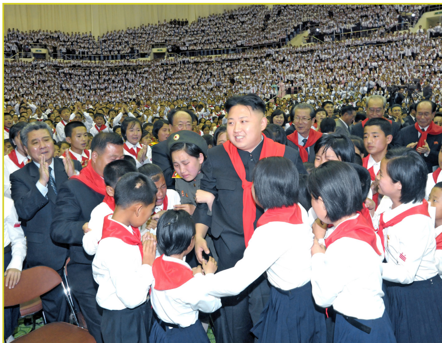
敬爱的最高领导者金正恩同志与参加朝鲜少年团成立 66周年庆祝活动的代表们在一起。