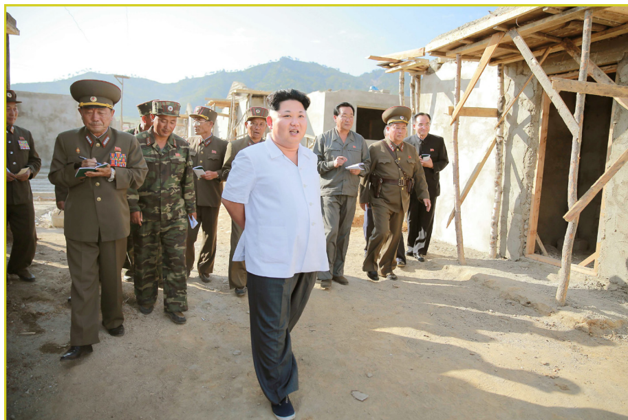
敬爱的最高领导者金正恩同志在现场指导罗先市灾区重建工地。