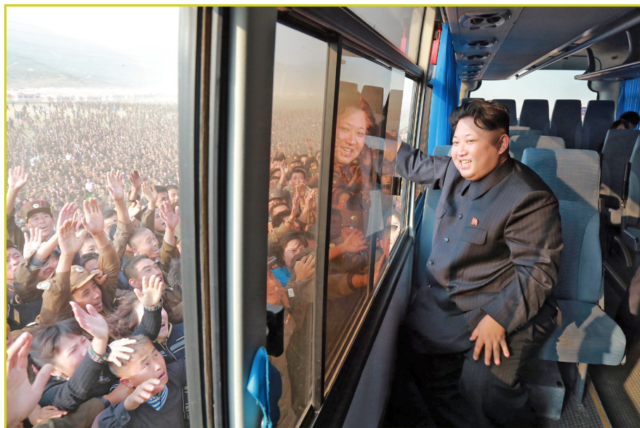
敬爱的最高领导者金正恩同志向欢呼的军人挥手还礼。