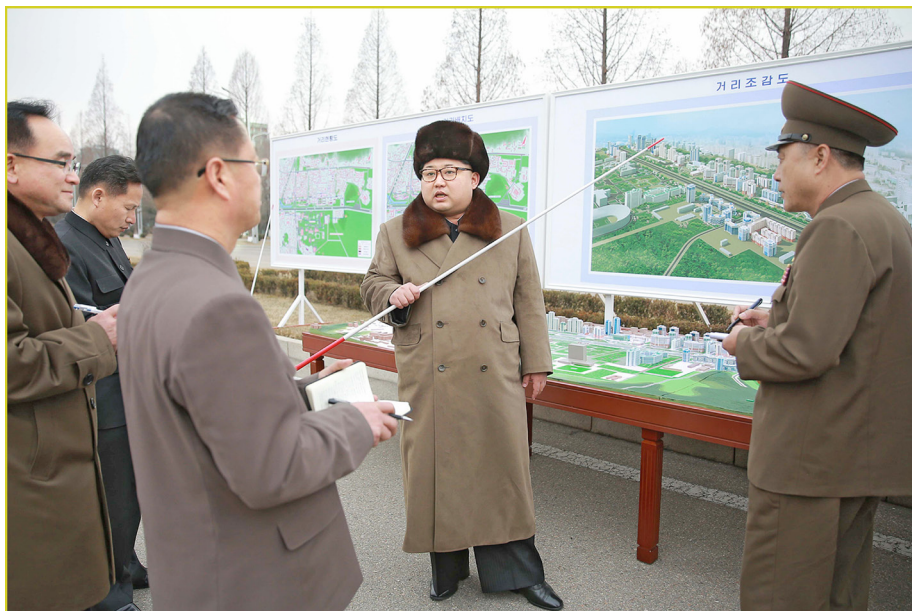
敬爱的最高领导者金正恩同志宣布启动 黎明大街建设工程，并指出建设 工程中的纲领性任务。