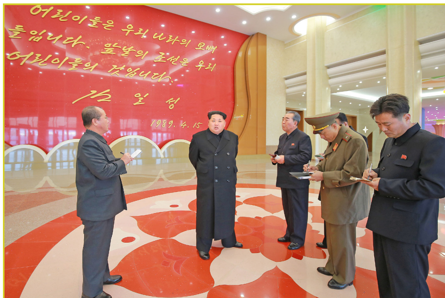
敬爱的最高领导者金正恩同志视察完成改建的万景台学生少年宫。