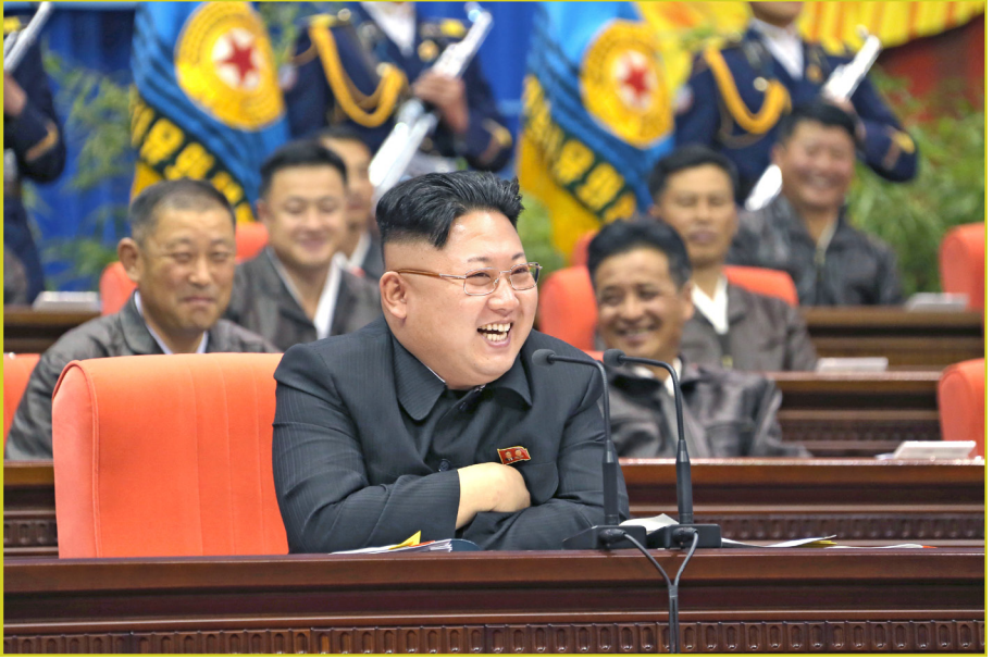
敬爱的最高领导者金正恩同志指导朝鲜人民军第一次飞行员大会。