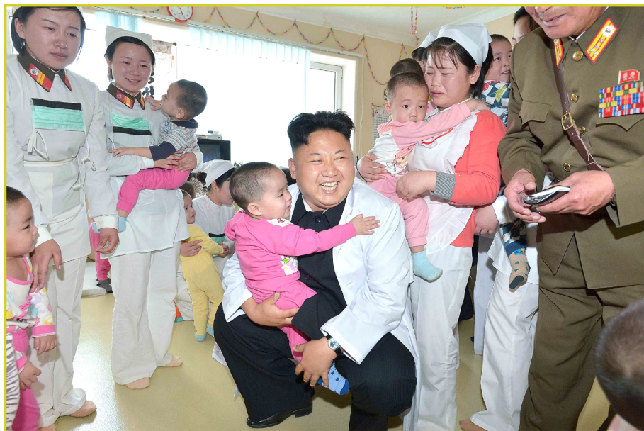
敬爱的最高领导者金正恩同志视察大城山综合医院。