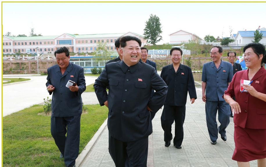
敬爱的最高领导者金正恩同志视察寺洞区将泉蔬菜专业合作农场。