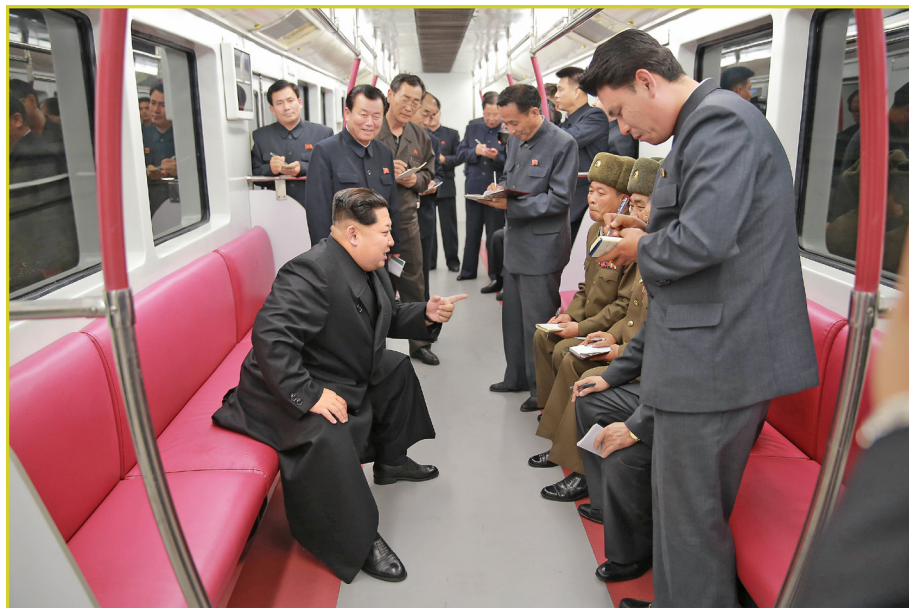
敬爱的最高领导者金正恩同志了解新制造的地下电动车试车情况。